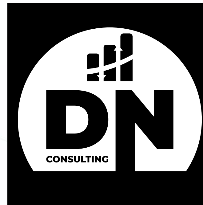
Logotype sur fond noir ou sombre